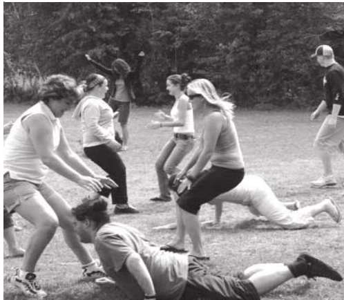
Des jeunes de LOVE participent à des jeux favorisant l'esprit d'équipe dans le cadre du camp de leadership LOVE 2006.

Nous sommes extrêmement fiers de chaque jeune leader du camp et nous savons qu'ils luttent à enrayer la violence, un jeune à la fois.