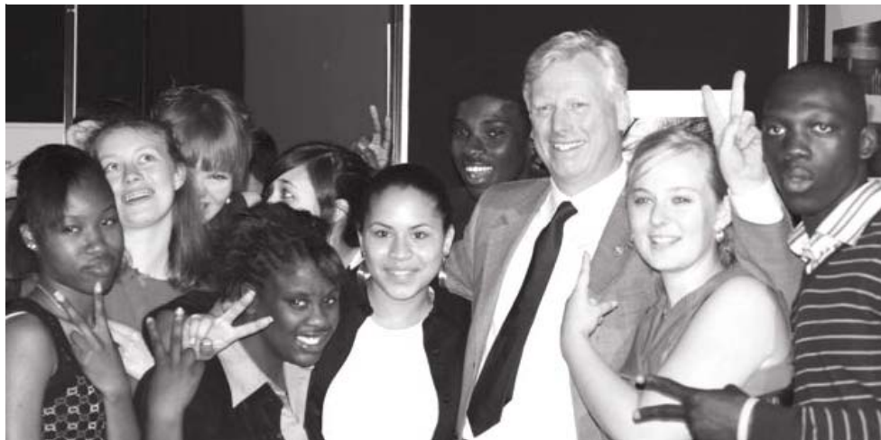
Le maire de Toronto, David Miller, se fait prendre en photo avec des jeunes de LOVE Ontario.

Dans le but de localiser sa programmation, LOVE Ontario travaille depuis cette année dans le quartier St. Jamestown, près de l'Université Ryerson où sont livrés les programmes de photojournalisme. Le programme de présentations en milieu scolaire demeure solide à Toronto avec ses 11 comités de prévention de la violence (CPV). "Il y avait fréquemment des bagarres dans ma classe de 6e année mais depuis que nous avons le programme LOVE, nous réglons nos problèmes de façon pacifique. Les plus jeunes de l'école nous observent discuter et essayent eux aussi de chercher de meilleurs moyens de régler leurs conflits," nous disait un jeune participant des programmes.